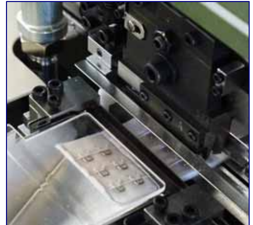
オプション：ナイフカット装置