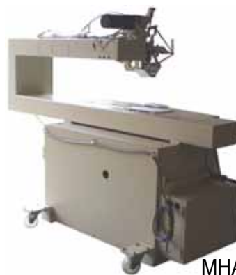
MHA - 3000HR