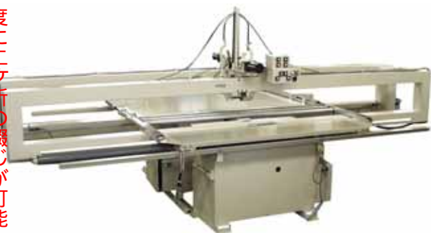
MHA - 3000W