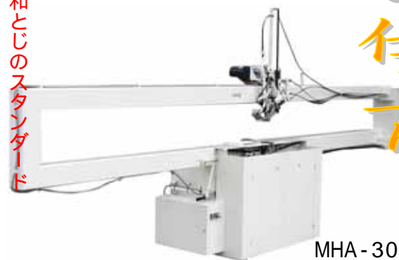
MHA - 3000